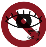
会場での大会放送視聴は禁止