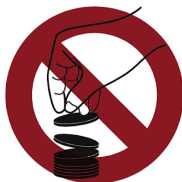
チップは一度に出しましょう

ゲームの妨げになるような大声での会話、禁止されたエリアでの喫煙や電子タバコの使用、周囲の視界を妨げるような帽子の着用、音楽プレイヤーの音漏れやゲーム進行の阻害行為、故意的なゲームの遅延、プレイ批判、カードを強く折り曲げるなどのマーキング、プレイヤー同士のサイドベット、他のプレイヤーの迷惑になるようなニオイや服装などはエチケット違反となる。重度の違反についてはペナルティや退場の処分となる場合がある。