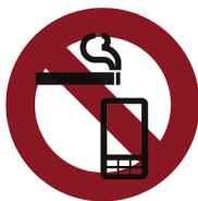
ゲーム中の携帯操作や視聴禁止 座席での喫煙・通話は禁止