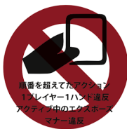
順番を超えてのアクション 1プレイヤー1ハンド違反 アクション中のエクスポーズ マナー違反